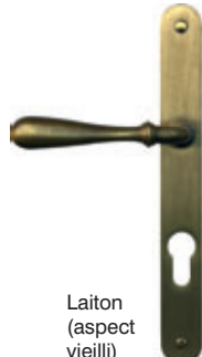
Laiton (aspect vieilli)