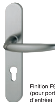
Finition F9 (pour porte-d'entrée)