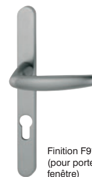
Finition F9* (pour porte-fenêtre)