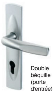
Double béquille (porte d'entrée)