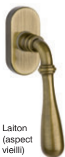
Laiton (aspect vieilli)