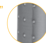
Ligne "Nathalie" finition nickel mat avec poinçons