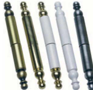
Caches paumelles décoratifs (uniquement sur fenêtres PVC)