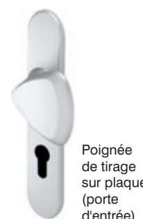
Poignée de tirage sur plaque (porte d'entrée)