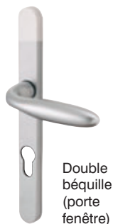
Double béquille (porte fenêtre)