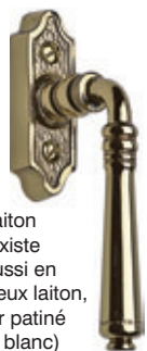
Laiton (existe aussi en vieux laiton, fer patiné et blanc)