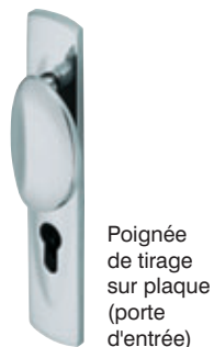
Poignée de tirage sur plaque (porte d'entrée)