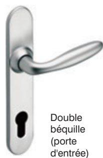
Double béquille (porte d'entrée)