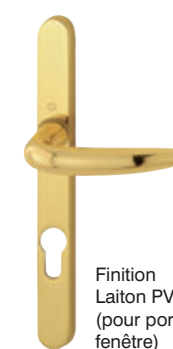
Finition Laiton PVD** (pour porte-fenêtre)