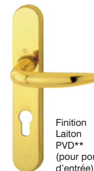
Finition Laiton PVD** (pour porte-d'entrée)